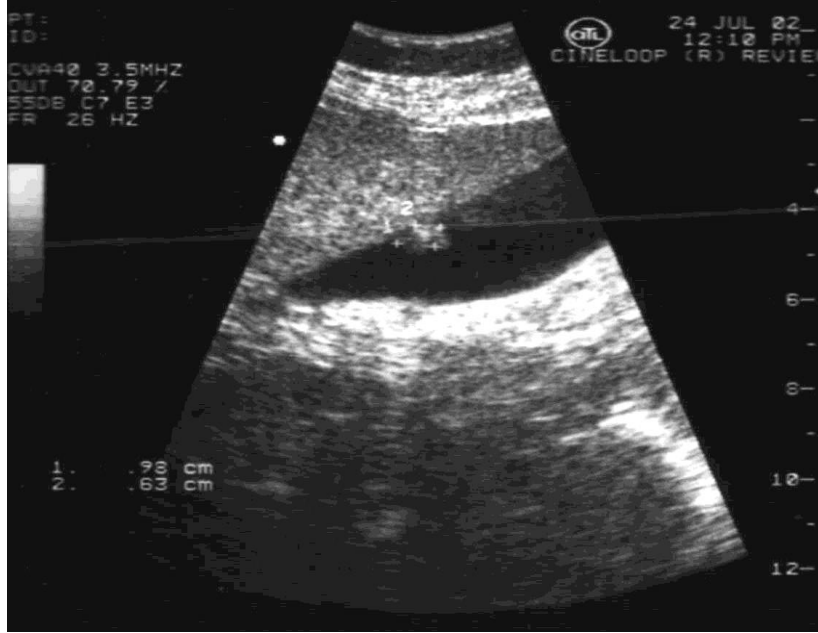
Resim 2: Safrakesesi polibinin USG görünümü.

yonların ayırıcı tanısının daha iyi yapılabileceği bildirilmektedir (12). Kesin ayırıcı tanı için USG eşliğinde perkutan transhepatik ince iğne aspirasyon biyopsisi (USG guided PC FNAB) yapılmasını öneren yazarlar vardır (8).